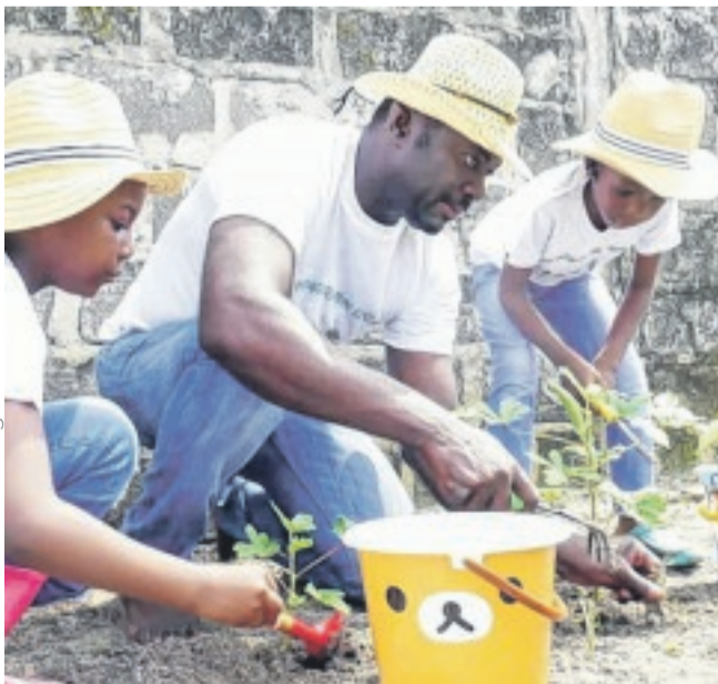
Apprentissage des jeunes aux pratiques de l'agriculture bio.

de la commune de Port-Gentil. D'où également ce programme à la fois théorique et pratique pour intéresser les enfants à l'agriculture. "Nous souhaitons déconstruire les mentalités des jeunes afin qu'ils ne perçoivent plus l'agriculture comme un métier traduisant l'échec social, mais plutôt comme le principal secteur devant sortir notre pays de la dépendance alimentaire étrangère et de la pauvreté", a-t-il souligné. En clair, pour le promoteur, la but visé par cette initiative est de faire changer progressivement les mauvaises habitudes alimentaires en créant des potagers familiaux dans les parcelles, les terrasses, les balcons, les pots, etc. C'est avec joie et entrain que les tout-petits se sont prêtés à l'initiation aux pratiques de l'agriculture bio. Des rudiments nécessaires, dont ils pourraient s'en souvenir et s'en servir quand ils seront grands.